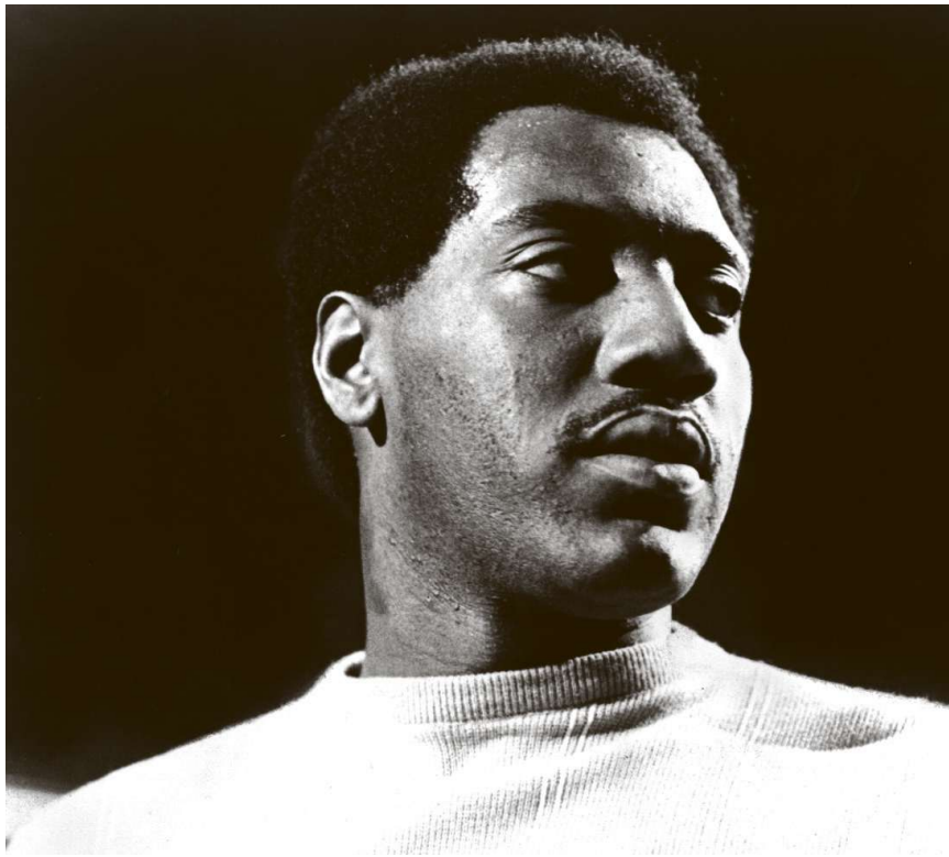
Er nannte sich Mr. Pitiful. Otis Redding war mit 26 Jahren ein hoch gehandelter Live-Act. Zu seinen vielen Talenten gehörte auch die Selbstironie.

Zum Zeitpunkt seines Todes mit 26 Jahren war Redding ein wohlhabender Mann: 1967 soll er mehr Platten verkauft haben als Frank Sinatra und Dean Martin zusammen, für seine ekstatischen Konzerte zahlten Veranstalter hohe Gagen. Reddings Appeal lag in sei-